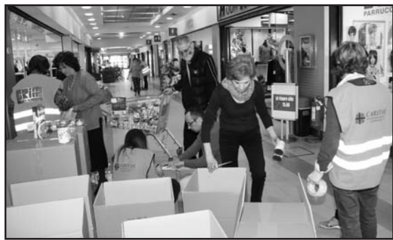
I prodotti offerti dalla clientela Coop.

“La COOP Consumatori Nord-est ha organizzato per il 29 marzo UNA COLLETTA ALIMENTARE straordinaria di prodotti da destinare alla Caritas di Montichiari ed al Grimm, organizzazioni che si occupano di arginare le nuove forme di povertà. Un importante momento che unisce la Coop, cooperative sociali, associazioni di volontariato dei distretti sociali, per sensibilizzare soci e clienti al problema della povertà attraverso l'invito a un gesto concreto di gratuità e di condivisione; fare la spesa alla Coop per donare una parte di prodotti opportunamente indicati, anche nel prezzo, sugli scaffali. L'esperienza del dono eccede ogni aspetto generando una sovrabbondante solidarietà, anche